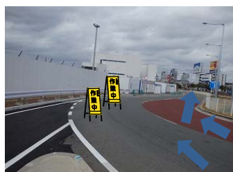
車線減少及び作業中看板を設置(夜間作業のみ)

2車線のうち1車線は走行不可、歩道は通行不可となります。 車道を歩行者迂回通路に使用します。