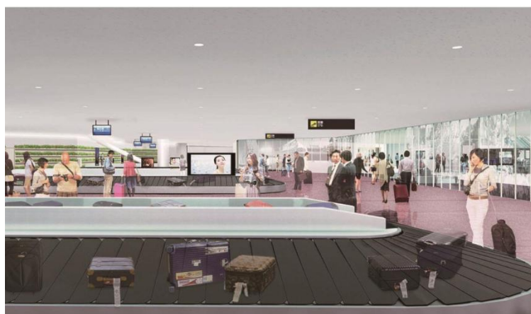
ターミナル南側 1 階手荷物受取所 (2018 年 8 月 29 日)