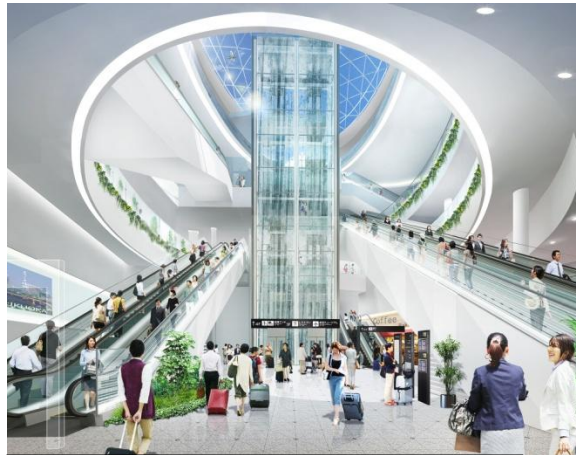
地下鉄アクセスホール (2019 年春)